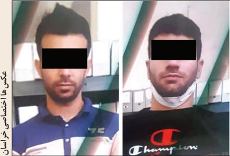
عکس ها اختصاصی می خراسان

خود را به پاتوق رساندند. بنابر گزارش خراسان، در حالی که راننده زبان دیده پراپید، دریافت خسارت را پیگیری می کرد، از آن سونیز راننده ال ۹۰ وقتی چشمانش را گشود که صبح شده بود. او هنگامی که خود را با دست و پاهای بسته دید، تازه فهمید که چه بلایی به سرش آمده است. کشان کشان خود را به آتشیز خانه رساند و موفق شد با چاقو، طناب ها را پاره کند. بعد از