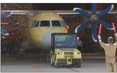
یک خودرو زرد رنگ با یک پره آبی در پشت سر، نمادی از نگاه سوم

امیر افشین خواج‌عفر در رئیس سازمان صنایع هوایی وزارت دفاع، درباره آخرین اخبار از هواپیمای ترابری سیمِرع گفت: ما هواپیمای ترابری سیمِرع را بر مبنای هواپیمای ایران ۱۴۰ توسعه دادیم و بیش از ۱۰ سال روی آن کار شده است. البته از همان موقع، نسخه ترابری ایران ۱۴۰ در دستور کار ما قرار داشت، منتها پس از این که کشور مبدأ با ما همکاری نکرد، هشت سال به تنهایی روی این پروژه کار کردیم. وی افزود: هواپیمای ترابری سیمِرع مراحل تا کسبی خود را انجام داده که باز خورد ما از این مرحله بسیار خوب بوده و در آستانه پرواز این پرند هستیم. احتمال این که این پرنده، هم مورد توثوق نیروهای مسلح و هم ناوگان تجاری قرار بگیرد، وجود دارد. رئیس سازمان صنایع هوایی وزارت دفاع در پاسخ به سوالی درباره این که هواپیمای سیمِرع چه زمانی پرواز خواهد کرد؟ تصریح کر د: پیش‌بینی می‌کنم هواپیمای سیمِرع تا آخر دادر پرواز کند. امیر خواج‌عفر درباره به پیشنهادهای بخش تجاری کشور مان برای به خدمت گرفتن هواپیمای سیمِرع بیان کرد: اکنون بخش تجاری پیشنهادهایی را به ما ارائه کرده‌اند تا این هواپیما بتواند در حوزه ترابری با توان ۴ تا ۶ تن به‌بهره‌برداری برسد.