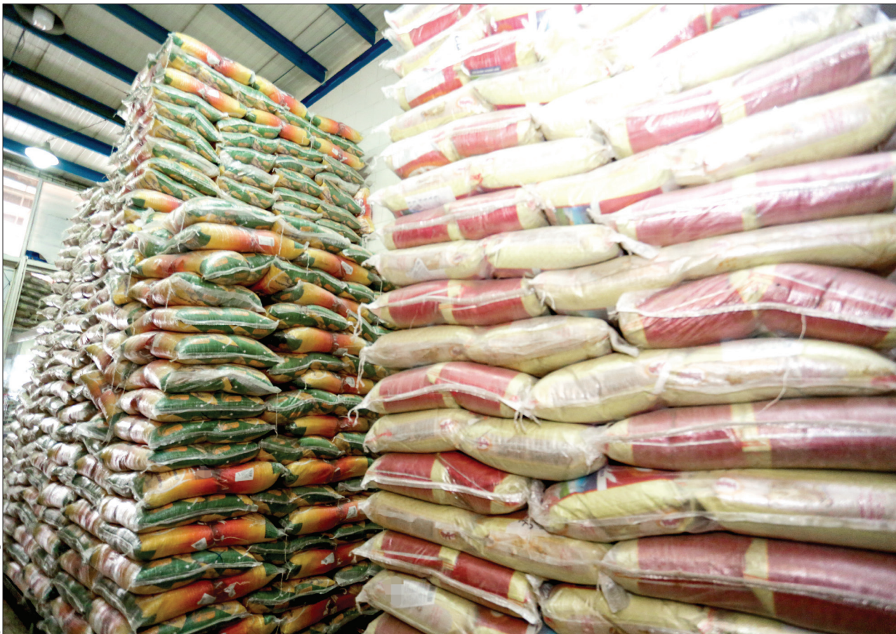
تولایی - عابدیان - قدس

قدس خراسان ماجرای برنج‌های تاریخ مصرف گذشته و ابعاد این پرونده را بررسی کرد