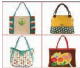
كَمْ عَدَدُ الْحَقَائِبِ؟