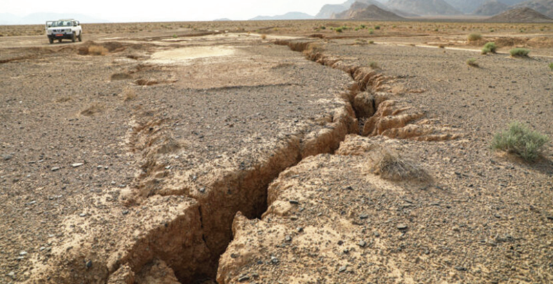
عکس تزئینی است

زمین لرزه بوده‌اند. نکته قابل تأمین این که در این ۴ ماه تنها استانی که در تمام این گزارش‌ها در جمع ۳ استان پر زلزله کشور قرار داشت، خراسان رضوی بود.