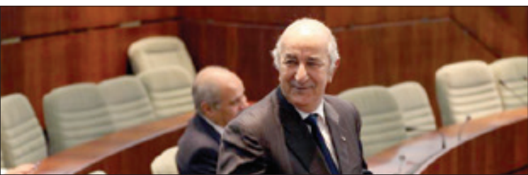
«عبدالمجید تبون» رئیس جمهور منتخب الجزایر سوگند یاد کرد

باخت بود. البته در این میان حزب ا... و شخص سید حسن نصر ا... کمتر و حریری بیشتر بازنده بودند. اما با رویدادهای کنونی، حداقل به صورت موقت موازنه به سمت حزب ا... تغییر کرده است. حزب ا... اگر چه به دنبال رأی آوری مجدد حریری - البته بدون معرفی از جانب خودش - بود، اما در شرایط فعلی، انتخاب وی به معنای دست برتر هشت مارس و حزب ا... لبنان است که از دیاب حمایت کرده است. گزینه های دیگری که جعجع و جنبلاط به دنبال آن بودند، روابط مستحکمی با آمریکا داشتند و رأی آوری آن ها، تهدید جدی برای منافق حزب ا... بود. در این میان، حریری را شاید بتوان بازنده اصلی تحولات اخیر دانست. وی که برای ماندن در قدرت، سه گزینه مطرح برای نخست وزیری را با کارت دار الفتوا سوزاند، نه تنها از سوی واشنگتن و ریاض چندان حمایت نشد، بلکه همراهی متحدان همیشگی خود به ویژه جعجع را نیز از دست داد. جعجع به طور آشکار به حریری اعلام کرده بود به وی رأی نمی دهد. بنابراین شاید تحولات اخیر را بتوان آغاز پایان قدرت نامیای حریری در لبنان دانست. اگر چه وی هنوز هواداران خود را در میدان دارد. به همین دلیل شرایط فعلی لبنان همچنان ملتهب و سیال است. از ساعاتی پس از انتخاب دیاب، هواداران حریری به خیابان ها آمدند و ضمن مخالفت با گزینه منتخب، راه های ارتباطی و خیابان ها را ایستاد. این نشان می دهد که معادلات لبنان پس از تحولات اخیر، علاوه بر ۱۴ و ۸ مارس، ضلع سومی نیز دارد؛ خیابان ها.